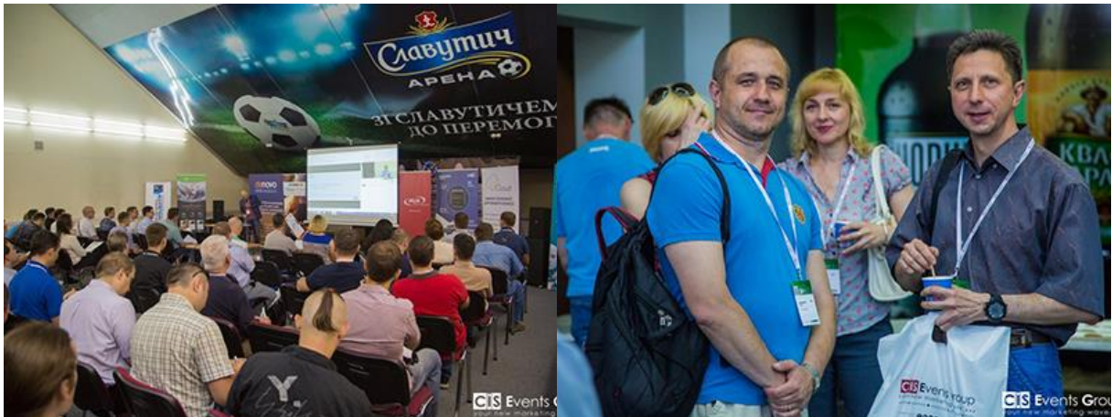
Міжнародний Форум ВІТ-2018 у Запоріжжі зібрав 119 учасників

Форум являє собою зручний майданчик для комунікацій , що об'єднує найбільш ініціативних представників вітчизняного ринку інформаційних технологій та автоматизації. Відзначимо, що в цьому році Форум відвідали 119 учасників!